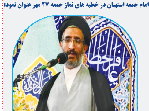
انتظارمان از همه دوستداران استهبان این است که انشا... طبق مصوبه قانونی، برنامه های روز استهبان از این به بعد با همدلی و وحدت در ۱۷ مرداد ماه برگزار شود و مهم این است که بتوانیم امروز مشکلی از مشکلات مردم استهبان حل کنیم.