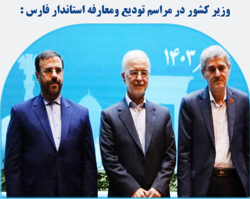
* استانداران پس از یک سال ارزیابی می شوند*