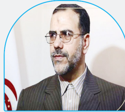
پیام استاندار جدید فارس خطاب به مردم شریف استان*